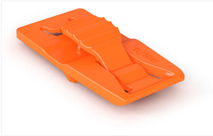
Farbe: ■ orange