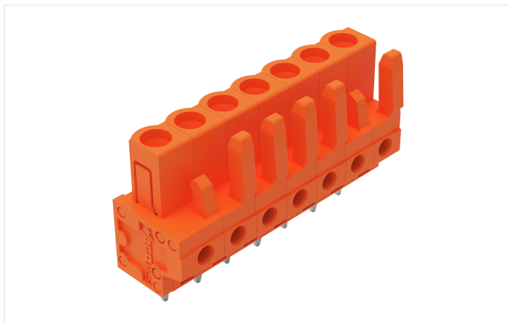
Farbe: ■ orange