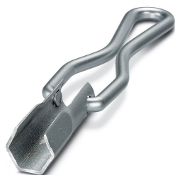
Steckschlüssel, zum Lösen bzw. Festdrehen der QUICKON-Überwurfmutter, Schlüsselweite 22 mm

Bitte beachten Sie, dass die hier angegebenen Daten dem Online-Katalog entnommen sind. Die vollständigen Informationen und Daten entnehmen Sie bitte der Anwenderdokumentation. Es gelten die Allgemeinen Nutzungsbedingungen für Internet-Downloads. ( http://phoenixcontact.de/download )