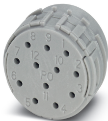
Kontakteinsatz, Polzahl: 12, Kontaktart: Stift, Crimpanschluss

Bitte beachten Sie, dass die hier angegebenen Daten dem Online-Katalog entnommen sind. Die vollständigen Informationen und Daten entnehmen Sie bitte der Anwenderdokumentation. Es gelten die Allgemeinen Nutzungsbedingungen für Internet-Downloads. ( http://phoenixcontact.de/download )